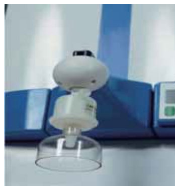
除热原型终端过滤器可提供无热源、无核酸酶的超纯水。

Labonova Direct系统配备所有需要的启动耗材，可即时使用。系统具有独特的预处理模块，可以自来水为水源制备符合反渗透(RO)要求的水，储存到7升的集成水箱内。当需要使用18.2MΩ.cm的I类水时，将RO水从水箱输送至痕量级脱盐的抛光树脂过滤柱进一步净化。该机器标配双波长UV装置，配合低TOC专用过滤柱，可将产水TOC含量降至5ppb以下。对HPLC、GC、离子色谱、TOC分析等应用非常理想。